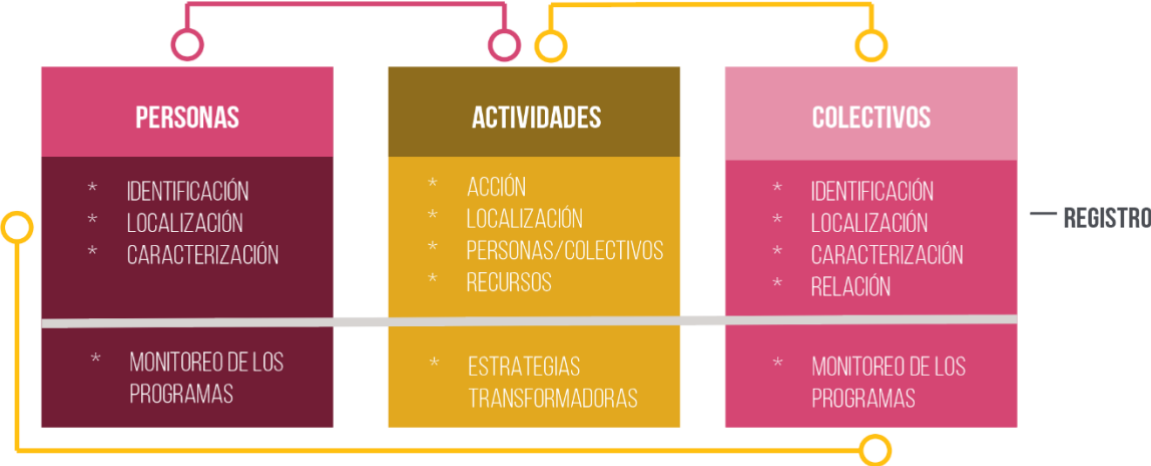
Esquema Registro de Igualdad y Equidad. Elaboración propia. Oficina de Saberes y Conocimientos Estratégicos. 2024

La estructura del RIE, está conformada por las unidades de observación y las funciones del mismo, las unidades de observación conforme a lo establecido en la Resolución 772 de 2024 son personas, colectivos y actividades. Para cada una de estas unidades, existen dos dimensiones de información, por un lado, la información de registro asociada con la identificación, localización y caracterización de cada unidad; y la segunda, respecto a los campos necesarios para el cálculo de los indicadores descritos en la fase de planeación.